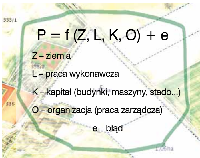
Rys. 1. Produkcja rolnicza jako funkcja czterech czynników wytwórczych

Wypracowany dochód wraz z amortyzacją (ten niepieniężny umowny koszt zużycia środków trwałych pozostaje w dyspozycji zarządzającego) jest rozdysponowywany na umowną opłatę pracy własnej i spłatę rat kredytów, a pozostająca reszta to nadwyżka na samofinansowanie